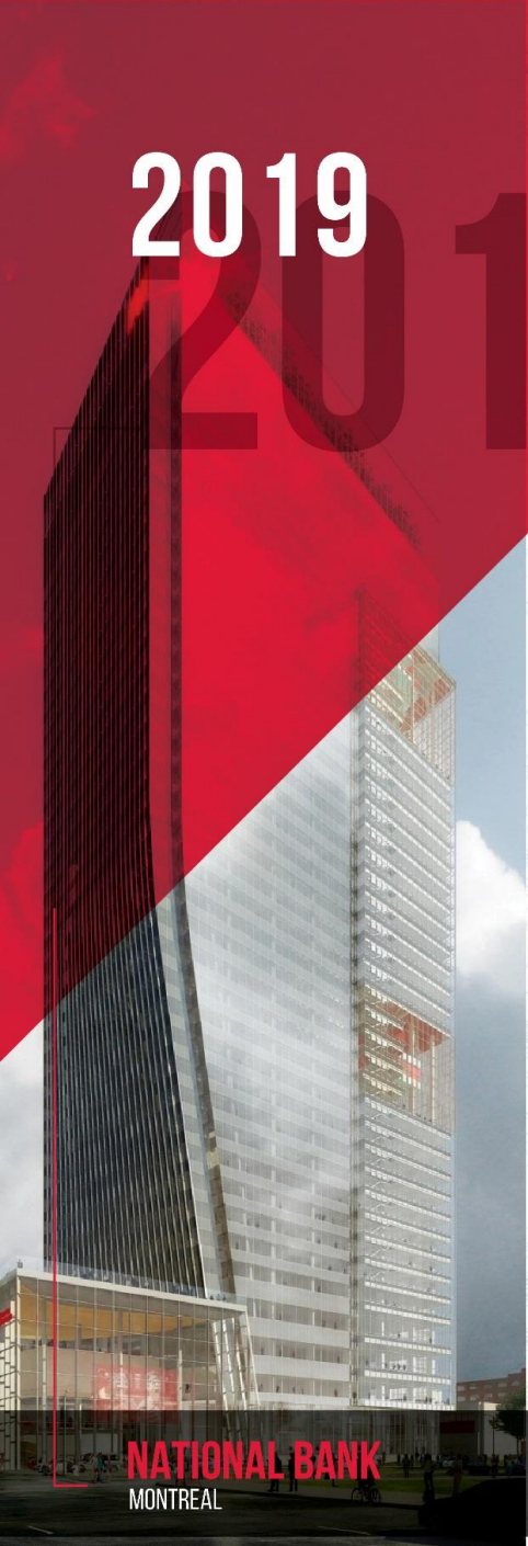
NATIONAL BANK MONTREAL