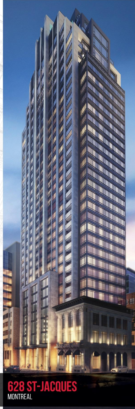
628 ST-JACQUES MONTREAL