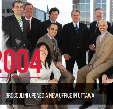
BROCCOLINI OPENED A NEW OFFICE IN OTTAWA