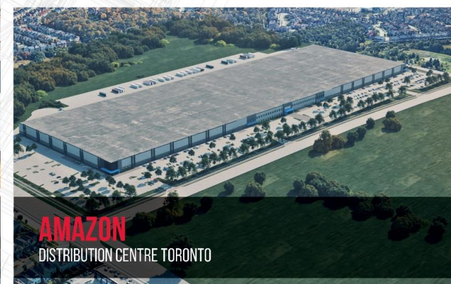
AMAZON DISTRIBUTION CENTRE TORONTO