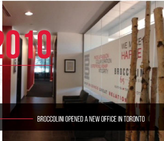
BROCCOLINI OPENED A NEW OFFICE IN TORONTO