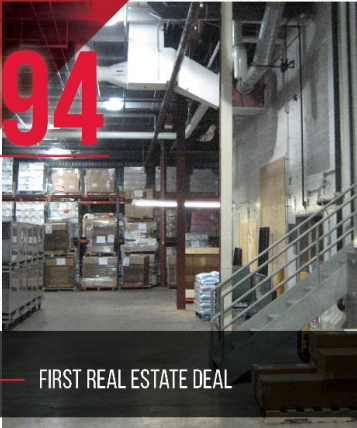
FIRST REAL ESTATE DEAL