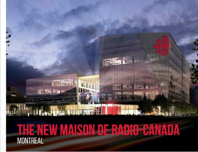
THE NEW MAISON DE RADIO-CANADA MONTREAL