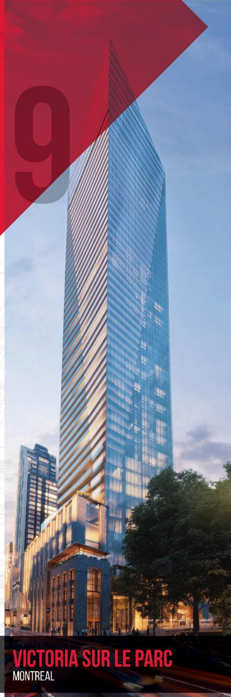
VICTORIA SUR LE PARC MONTREAL