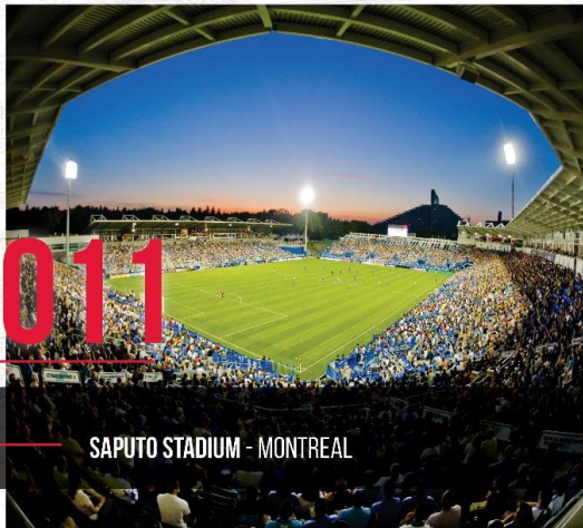
SAPUTO STADIUM - MONTREAL