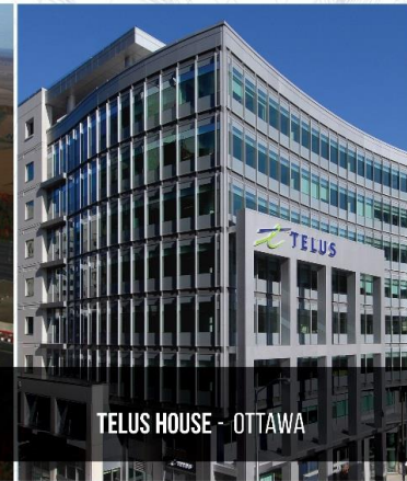
TELUS HOUSE - OTTAWA