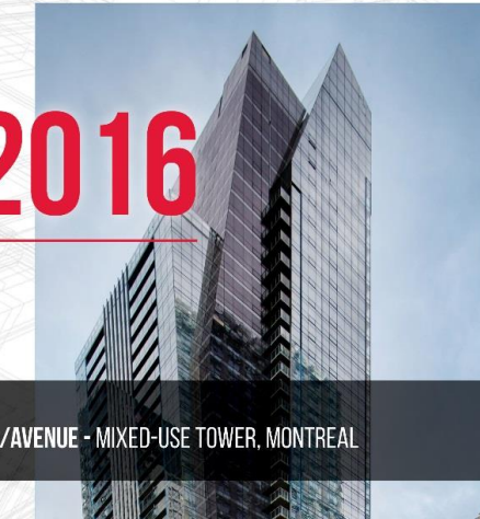
L/AVENUE - MIXED-USE TOWER, MONTREAL