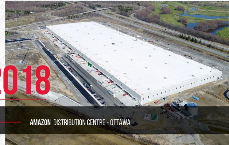
AMAZON DISTRIBUTION CENTRE - OTTAWA