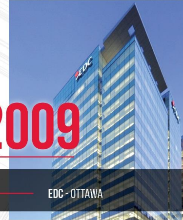
EDC - OTTAWA