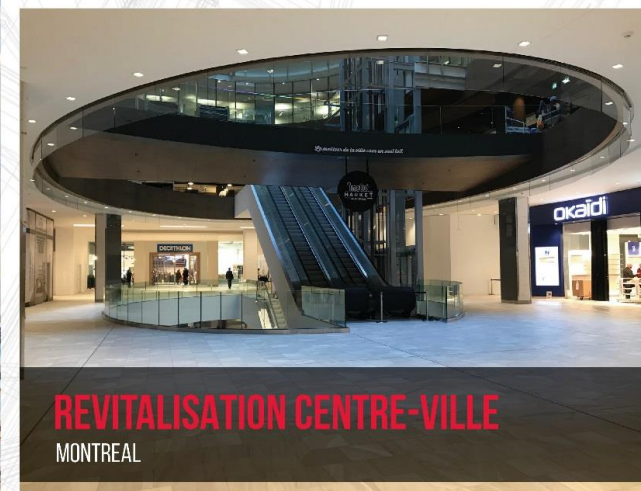
REVITALISATION CENTRE-VILLE MONTREAL