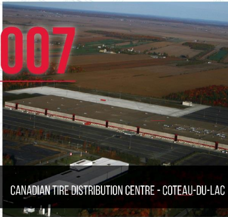
CANADIAN TIRE DISTRIBUTION CENTRE - COTEAU-DU-LAC